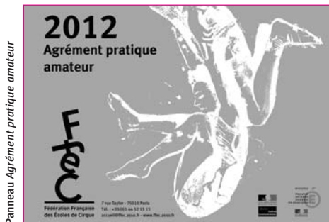
Panneau Agrément pratique amateur

** convention cadre du 21 juillet 2010 et cahier des charges activités circassiennes à l'école, au collège et au lycée, septembre 2012